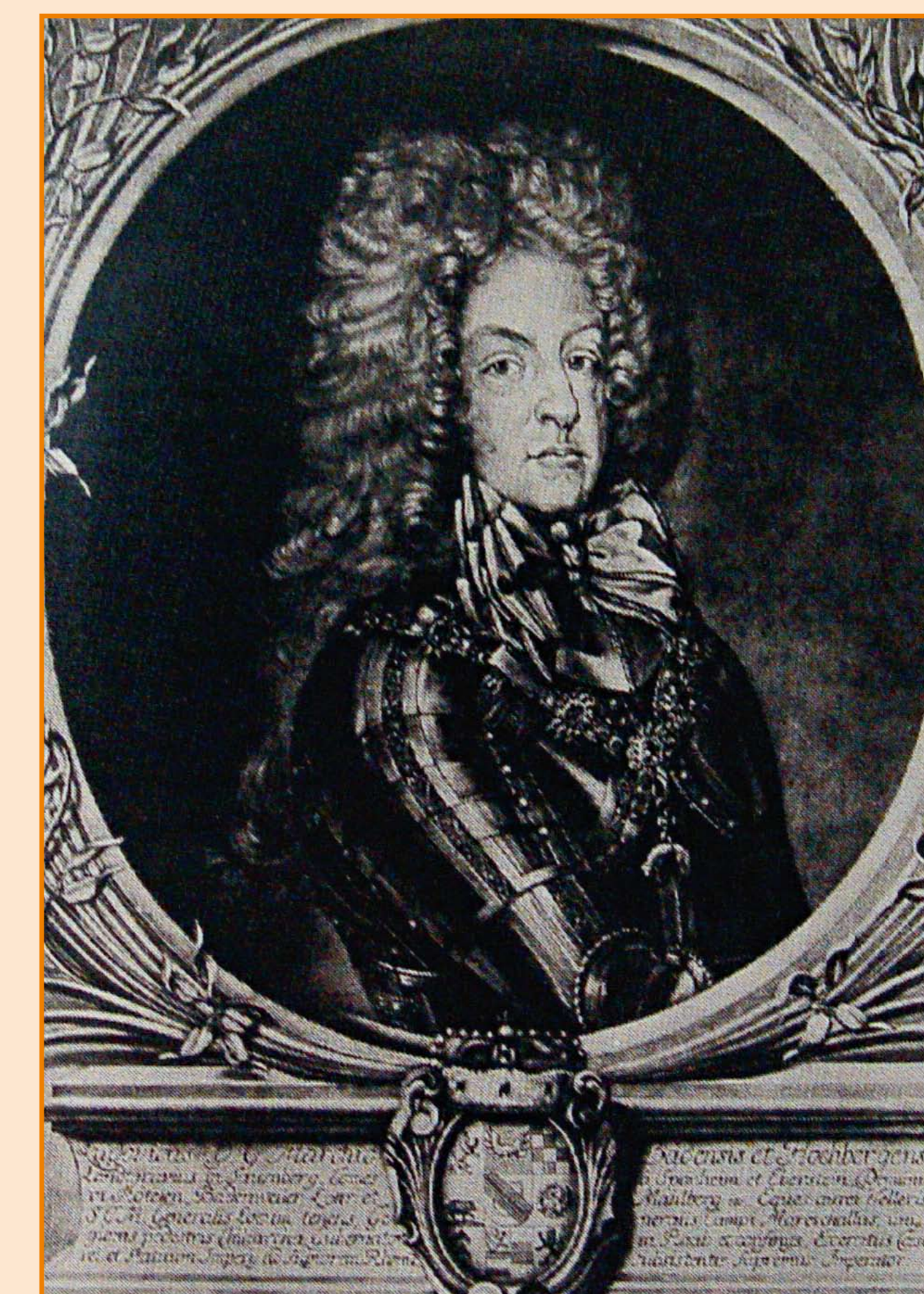
Markgraf Ludwig Wilhelm von Baden, genannt Türkenlouis

Doch während der Türkenlouis mit Mut und beherztem Einsatz die Osmanen wieder auf den Balkan zurückdrängte, ließ sein Patenonkel Ludwig XIV. sogar seine heimatische Residenz in Baden-Baden zerstören. Die Lage am Rhein war prekär. Kaiser Leopold I. blieb nichts anderes übrig, als den Türkenlouis 1693 als Oberbefehlshaber am Oberrhein einzusetzen. Ihm traute es der Kaiser zu, die zunehmende Bedrohung aus Frankreich zu bannen. Bestand doch die Gefahr, dass Ludwig XIV. die Vereinigung mit dem ihm verbündeten Bayern gelingt, um das gesamte Kaiserreich zu zerschlagen.