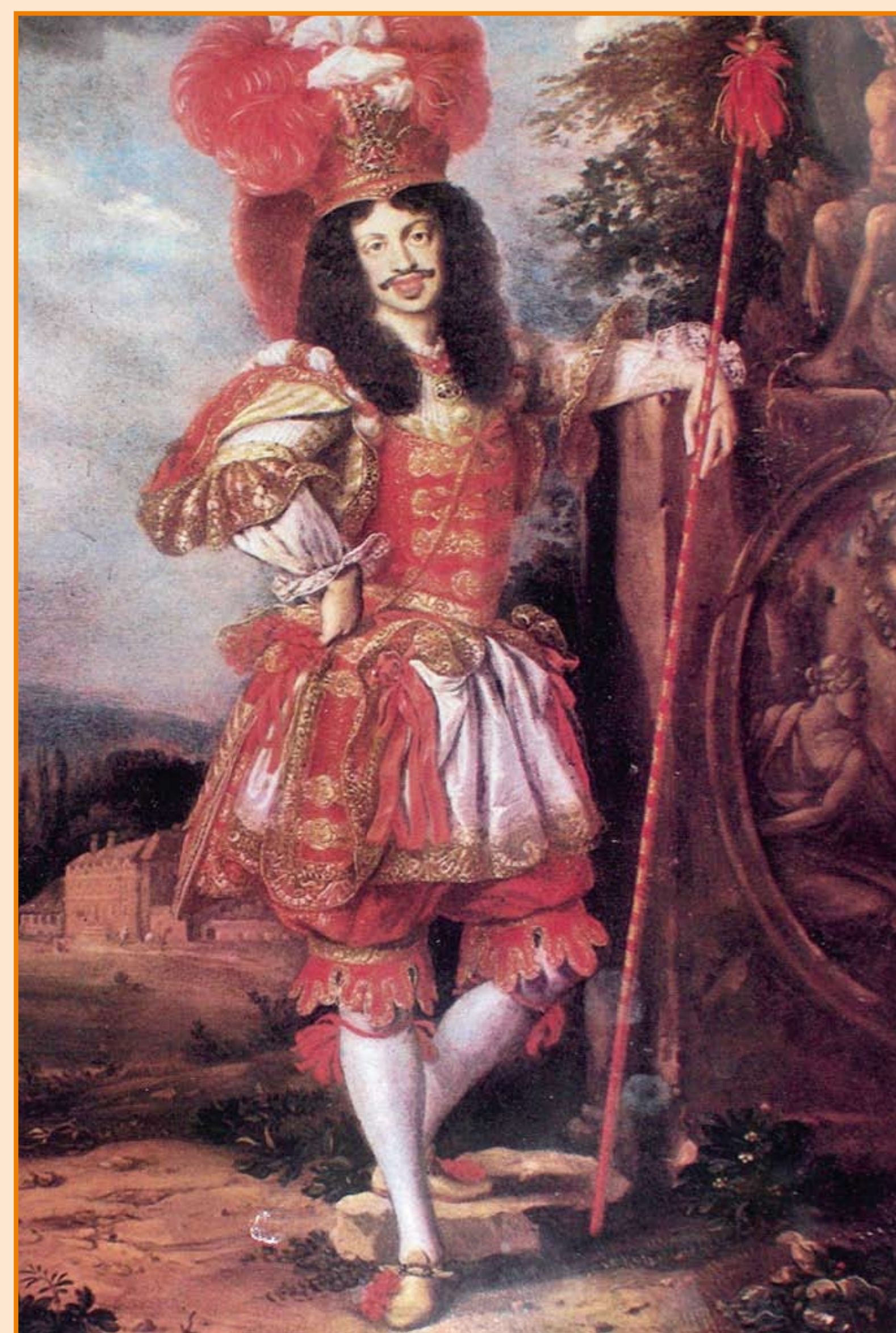
Kaiser Leopold I.

König Karl II. hatte keine Kinder und hinterließ ein Verwirrung stiftendes Testament. Die Folge: Frankreich und das Habsburgische Kaiserreich stritten um die Herrschaft über das spanische Erbe.