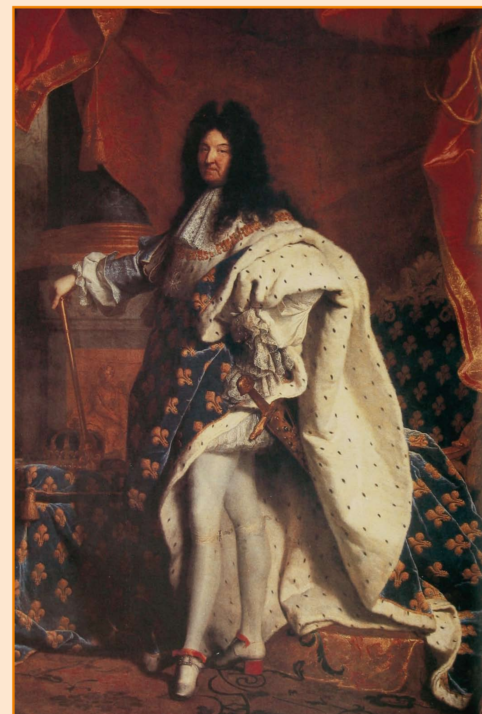
König Ludwig XIV., Portrait von Hyacinthe Rigaud 1701